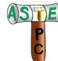
(Grのアイコン、3つの案から 全員で投票し決定)

：3月1日（日）の We Loveとよたフェスタ に、 車いすの世界線 で参加 フェスタ来場者に、 みんなが住みやすいまちを を考慮いただくために 車いすは通りやすく大人が歩いて通りにくい、 街歩き体験会 を実施 体験会は3回目。今回は 子供たちに落書きを楽しんでもらえるようにアレンジ