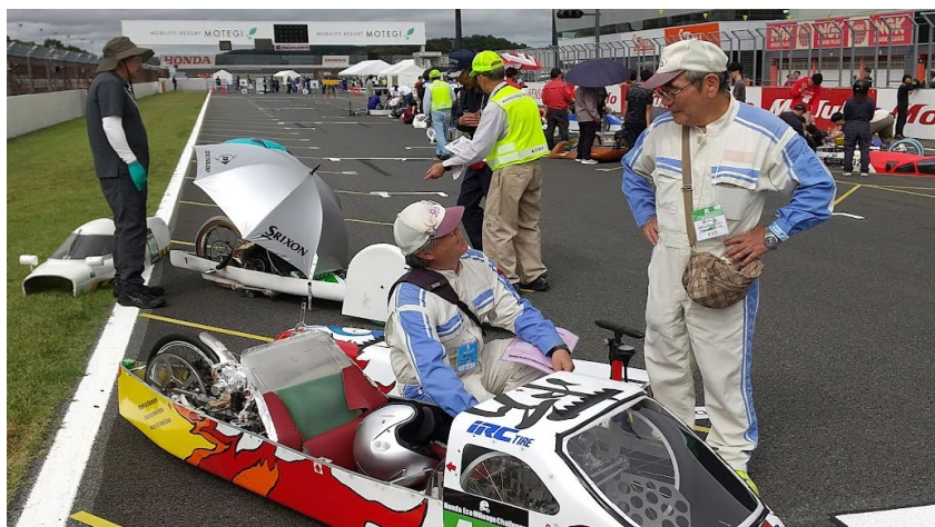
決勝スタート待機場場でエンジン暖気作業