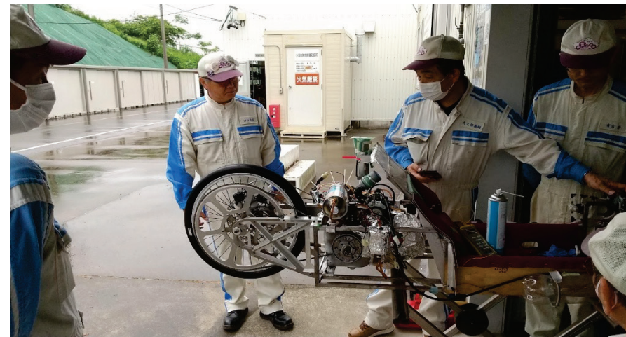
オイルタンクとヒーター取付け検討