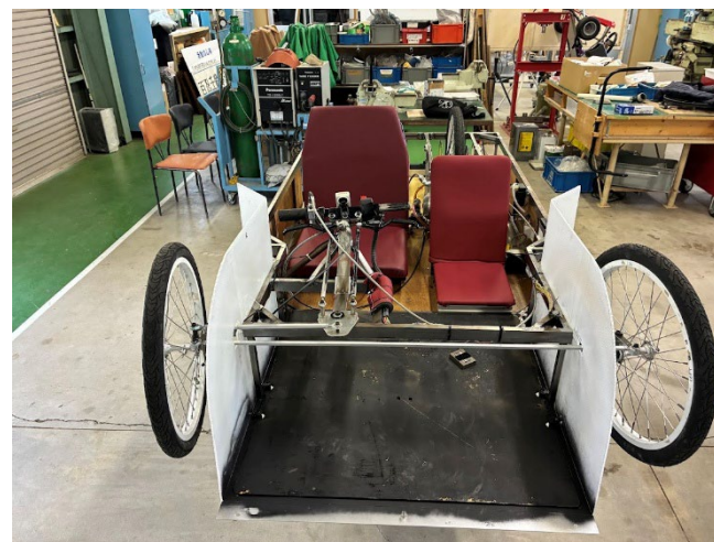
シート取付け完了