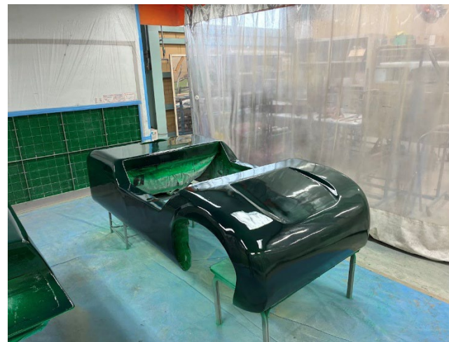
塗装(上塗り1回目終了)後のボデー