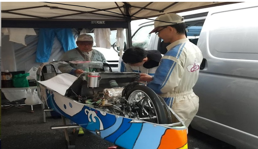
決勝走行前最終点検