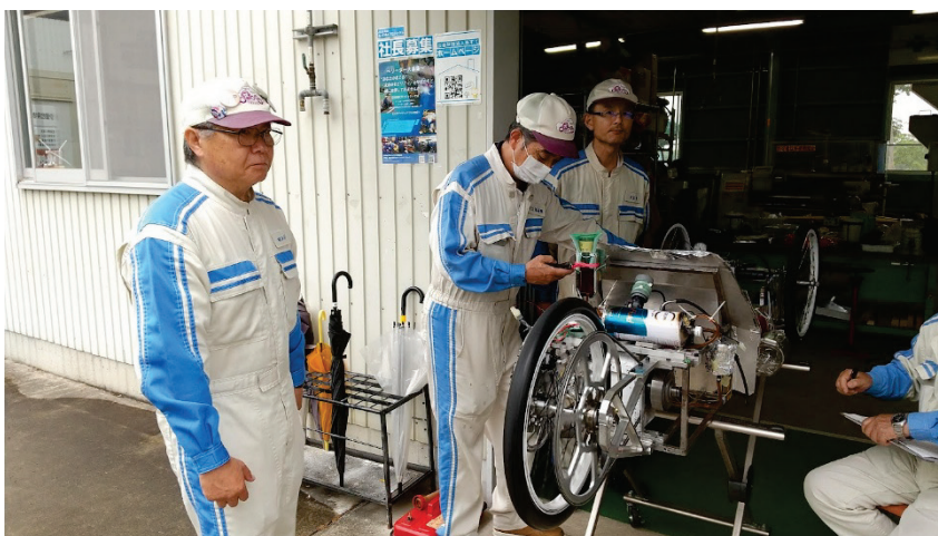
エンジンオイル温度低下時間測定