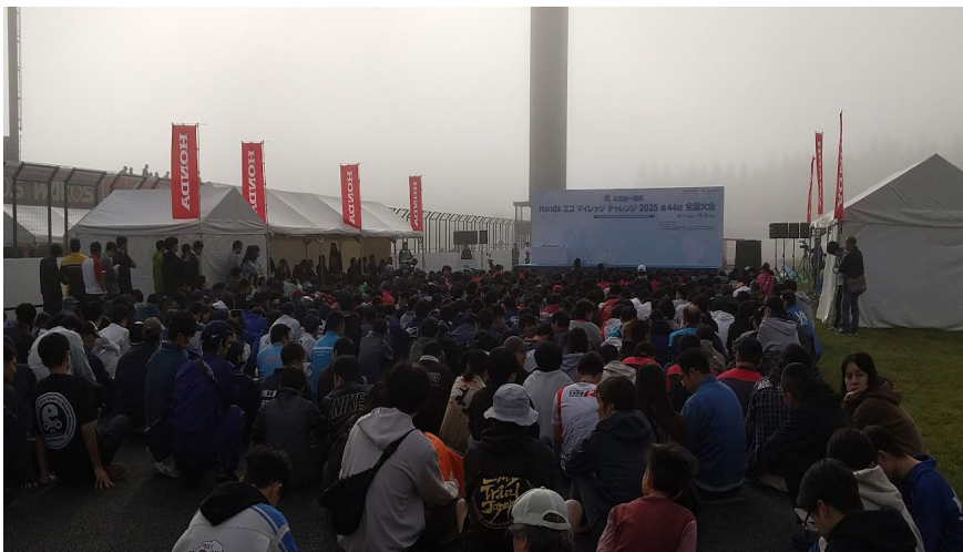
朝霧の中での開会式