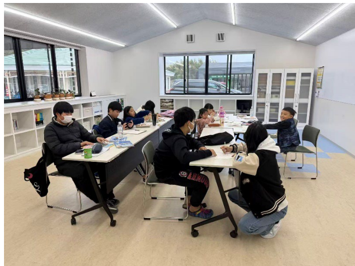
アート教室の様子