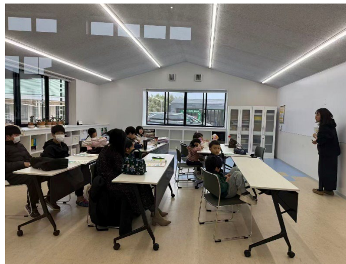
中国語教室の様子