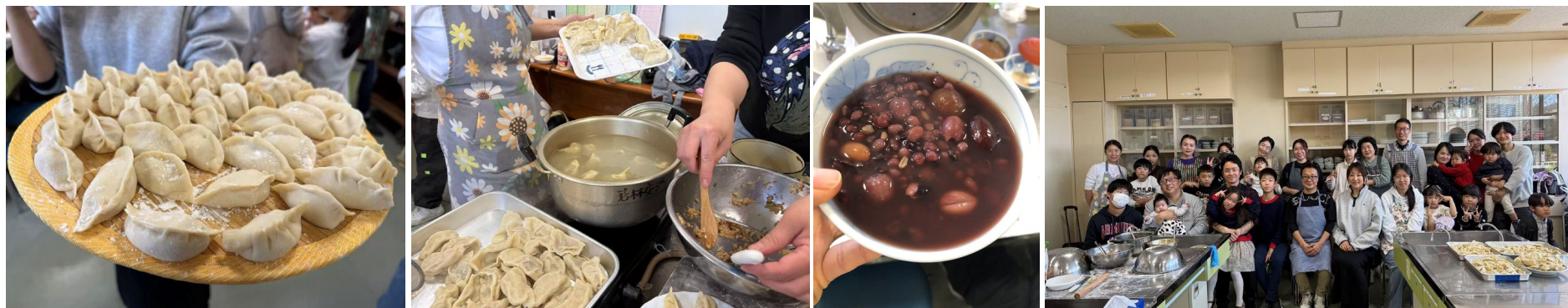
餃子と八宝粥を作り試食