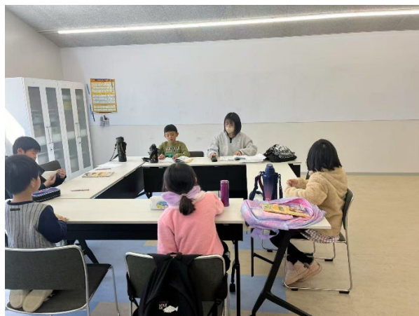
アート教室学習の様子