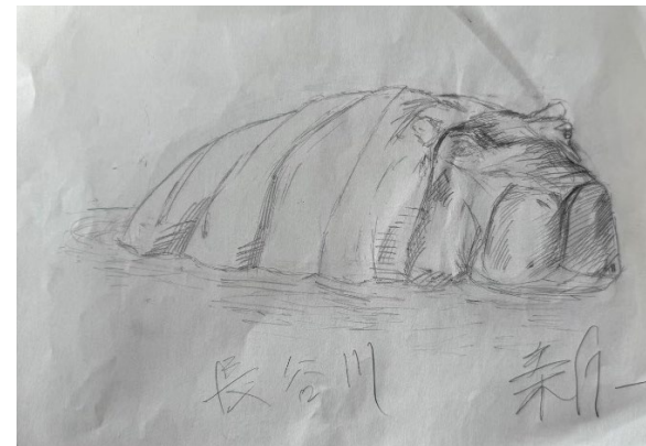
学習者書いた絵 (カバです)