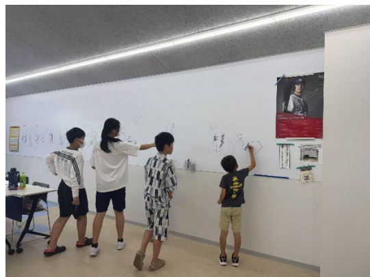
アート教室学習の様子

7月19日(土) 中級中国語参加者5名、アートクラス参加者8名、初級中国語参加者9名 学習者延べ20名、