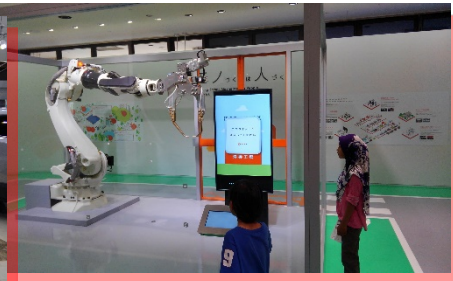
とよたかいかん トヨタ会館： 溶接ロボットの展示

世界的に有名なトヨタ自動車の工場を見学します。工場の中で働いている人の様子や、製造ラインの様子を見ることができます。安全に、効率よく、正確に車を作るために、いろいろな工夫をしていることが分かります。また、トヨタ会館ではトヨタ自動車についてより深く知ることができます。