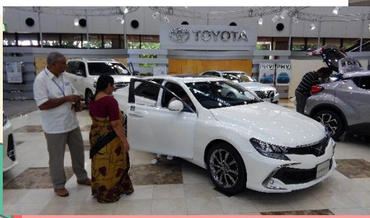
とよたかいかん トヨタ会館：トヨタの車と写真が撮れます。